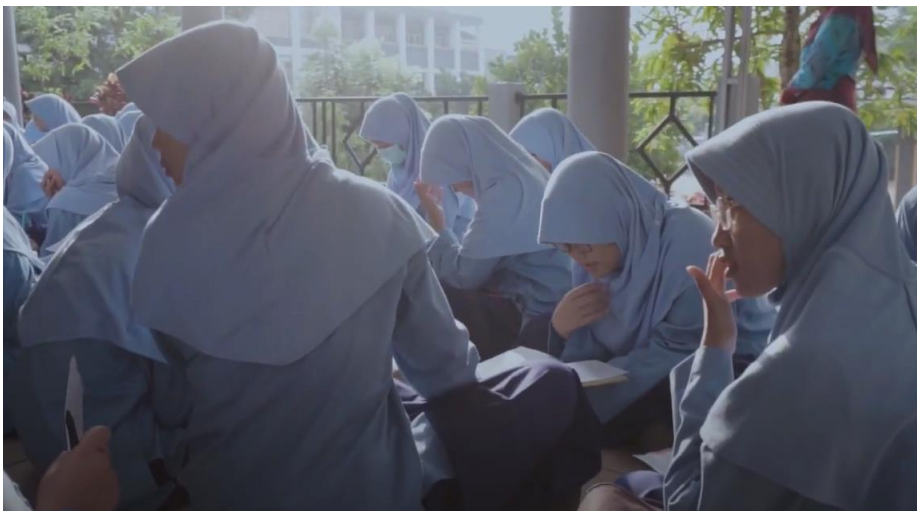
Literasi siswi yang sedang haid di pagi hari