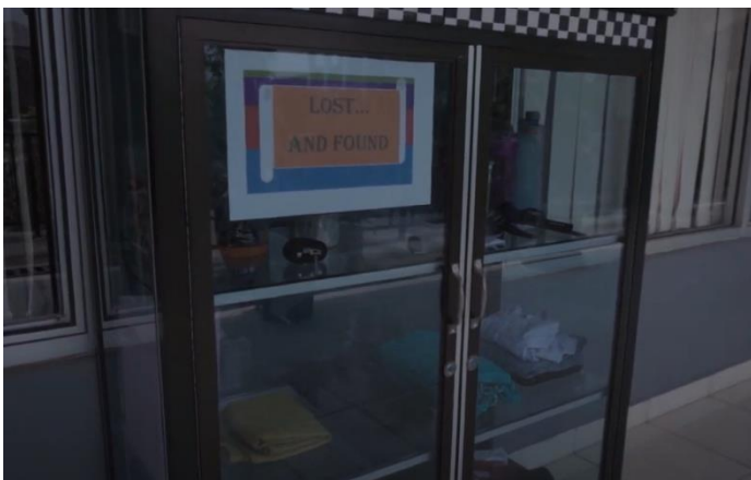
Lemari Lost n Found , jika siswa menemukan dan merasa kehilangan barang silahkan menuju ke lemari tersebut. Sebagai salah satu tools melatih kejujuran.