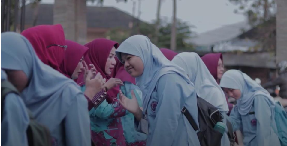
Setiap pagi guru menyambut murid dengan 5S (Senyum, Sapa, Salam, Sopan, Santun)