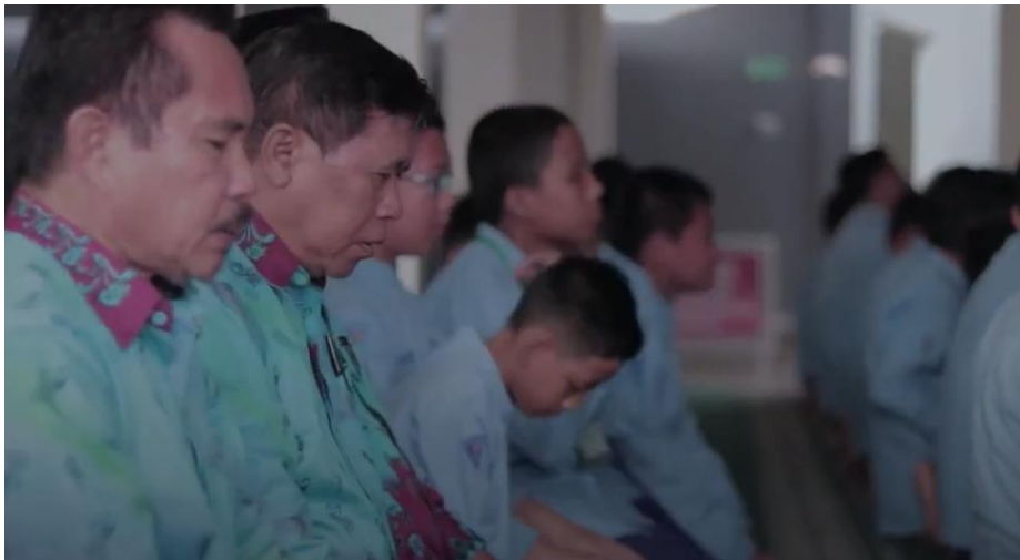
Siswa siswi, dewan guru dan staf melaksanakan sholat duha di waktu jam ke-0