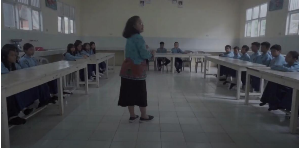
Siswa siswi yang beragama non muslim berkegiatan pengembangan budi pekerti bersama guru pemandunya di waktu siswa muslim melaksanakan sholat duha